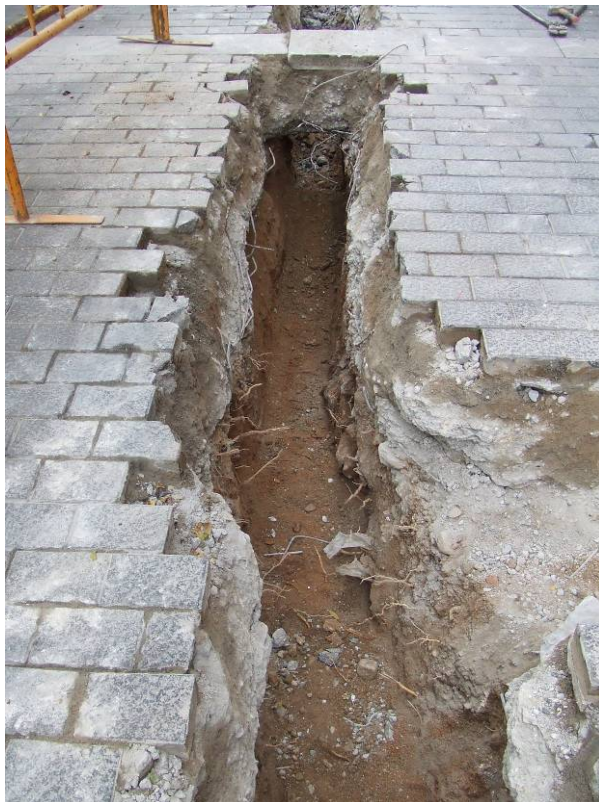
Fotografia núm. 3: vista de la rasa 100