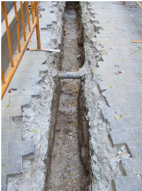
Fotografia núm. 1: vista de la rasa 100