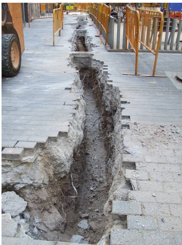
Fotografia núm. 2: vista de la rasa 100